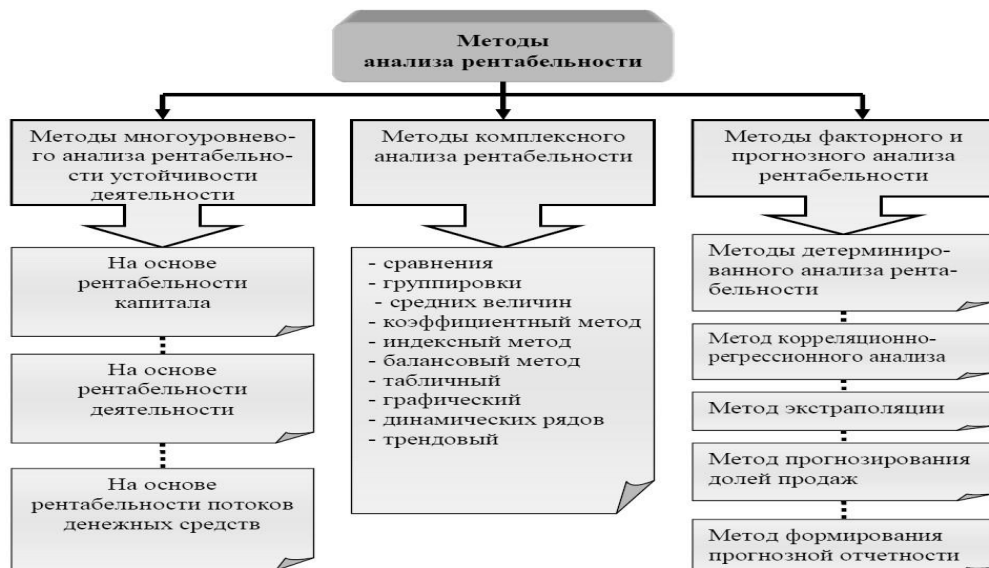
Рисунок 1. Основные методы анализа рентабельности организации

Графики, схемы, диаграммы, рисунки располагаются в курсовом проекте непосредственно после текста, в котором они упоминаются впервые, или на следующей странице. Иллюстрации следует нумеровать арабскими цифрами сквозной нумерацией (то есть по всему тексту) – 1,2,3, и т.д., либо внутри каждой главы – 1.1,1.2, и т.д.