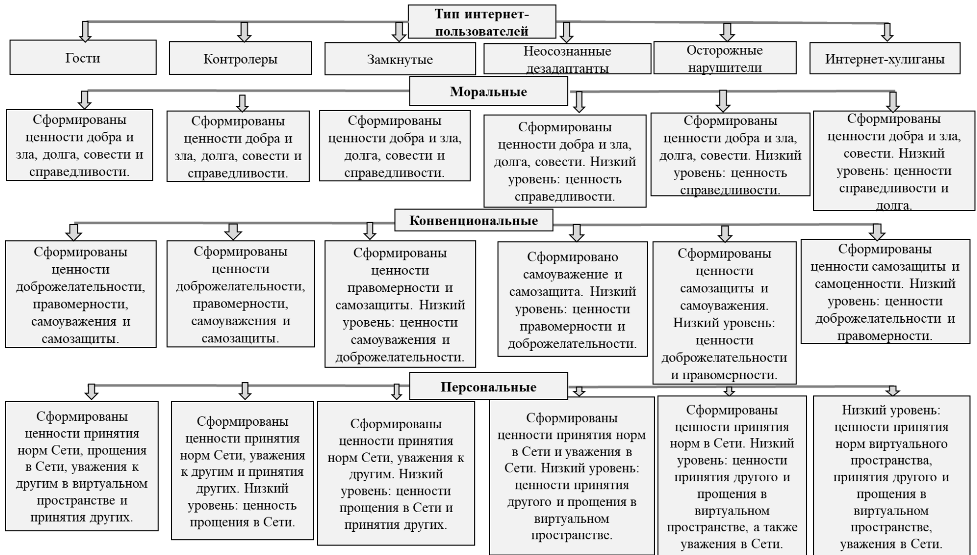
Рисунок 3. Особенности ценностной регуляции поведения интернет-пользователей