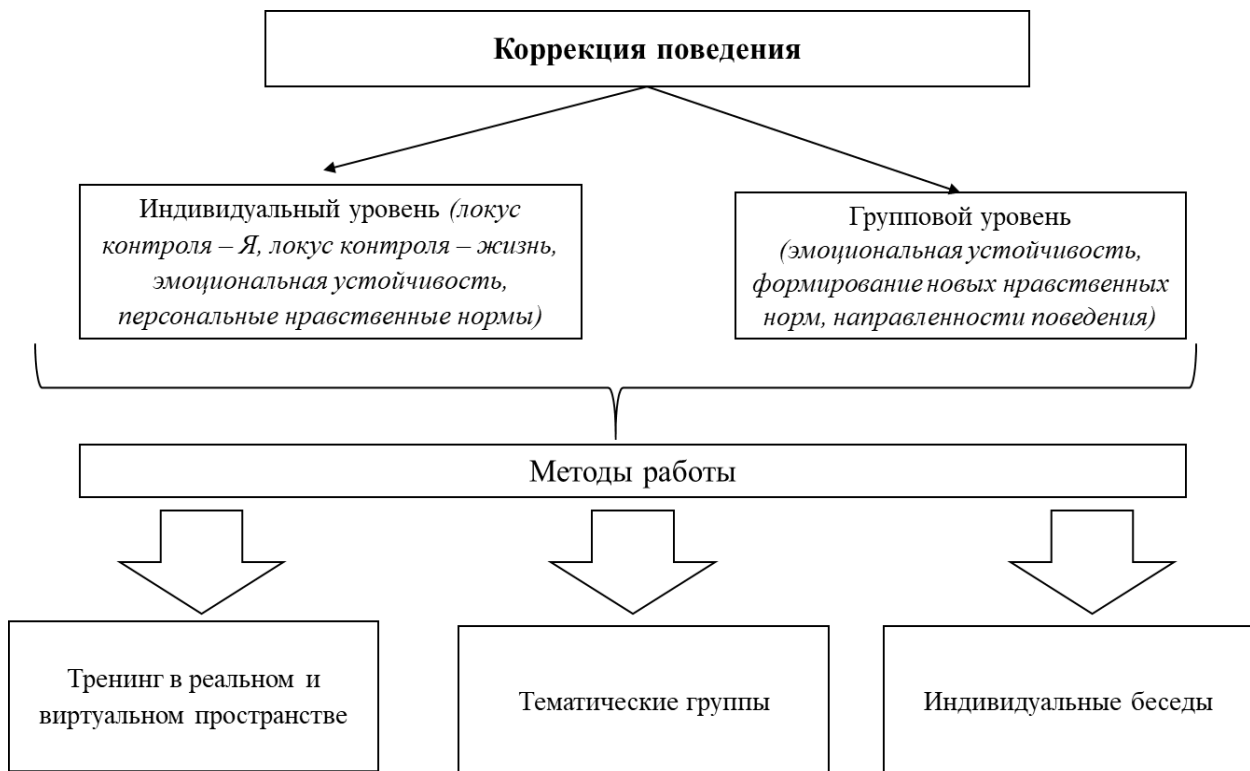
Рисунок 4. Модель психологической коррекции, разработанная для ненормативных групп пользователей

Программа психологической коррекции основывается на практике когнитивно-поведенческой терапии и предполагает два коррекционных блока: блок личностной коррекции и блок коррекции поведения. Учитывая описанные корреляционные связи, установлено, что при изменении личностных и поведенческих показателей будут изменяться и нравственные ориентации [Рисунок 4].